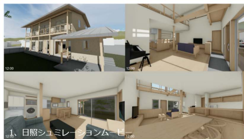
1,日照シュミレーションムービー