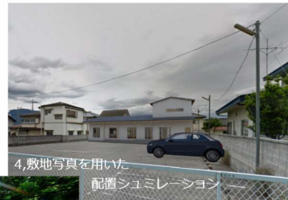
4,敷地写真を用いた